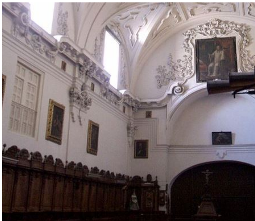
Sillería en la esquina inferior izquierda; tomado de: https://commons.wikimedia.org/wiki/File:Valladolid - Monasterio de San Quirce y Santa Julita 4.jpg