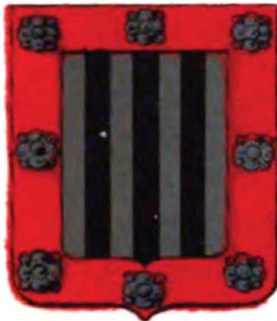
Armas del apellido Rosales.

repostero : yten un repostero biejo de armas ; yten otro repostero de armas demediado