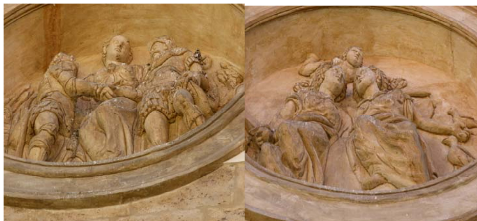
Medallones en las casas principales.

primeramente de las nuestras casas prinçipales que nos avemos y tenemos en esta villa de valladolid en la calle del rosario en que al presente bibimos y de las dos casas pequeñas que estan junto a ellas en el costado de las dichas casas prinçipales que salen a la calle del sauco y de las otras casas que compramos de justo balter aleman que estan en la dicha calle del rosario junto a las dichas nuestras casas prinçipales [...]