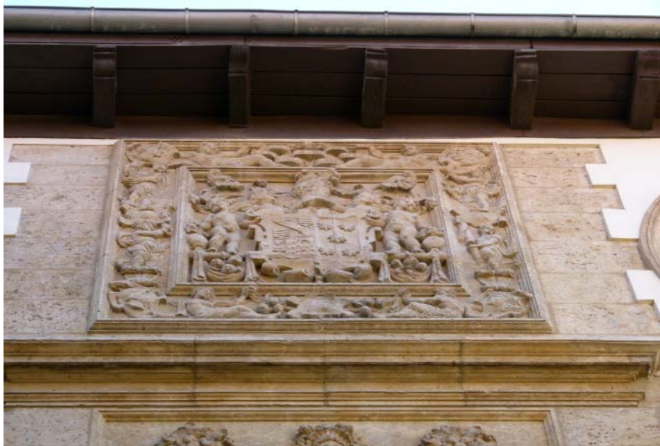
Escudo en la fachada del palacio de Butrón en Valladolid; Mújica-Butrón / Rojas.