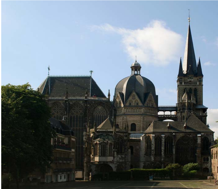
Catedral de Aix-la-Chapelle, lugar de la coronación.

otra vanderá quadrada de damasco negro con las armas del enperador frangeada de colorado amarillo y blanco